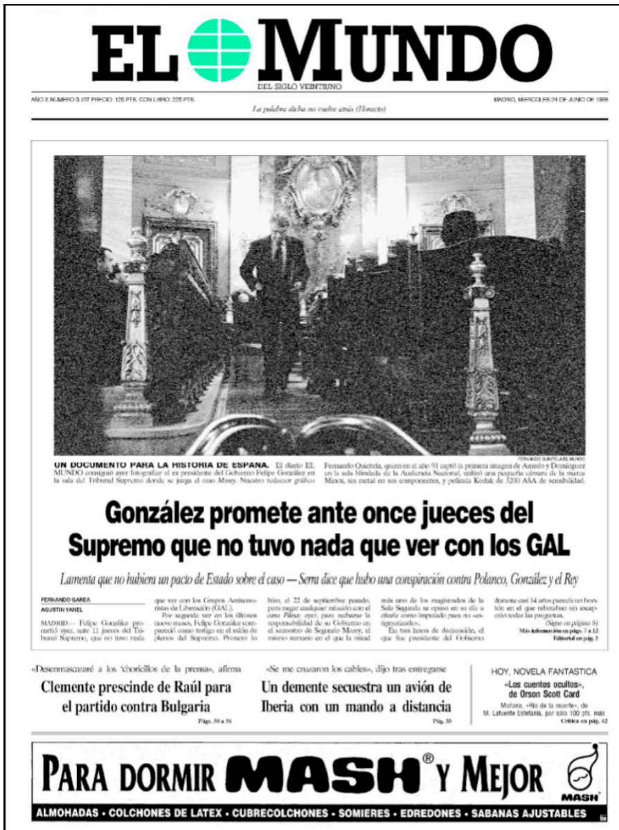
Figura 1.- El ex primer ministro español Felipe González en el Tribunal Supremo, fotografiado por el periodista camuflado Fernando Quintela ( El Mundo , 24 de junio de 1998).

Imagen recuperada el 15 de noviembre de 2018 de https://www.elmundo.es/album/television/2017/05/10/59120c18e5fdea1a718b4590_13.html